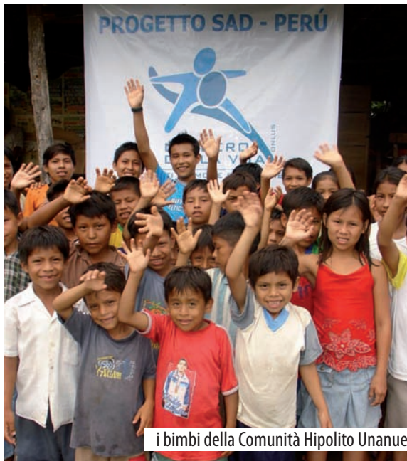
i bimbi della Comunità Hipolito Unanue

L'area amazzonica si caratterizza per lo sviluppo dell'estrazione petrolifera che purtroppo non garantisce una redistribuzione della ricchezza verso la popolazione che rimane povera ed in balia degli eventi: le aree più povere sono principalmente concentrate nelle zone montuose e rurali dove le condizioni igienico-sanitarie sono critiche; la situazione dell'ordine pubblico è carat-