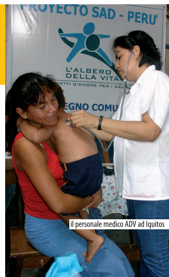
il personale medico ADV ad Iquitos