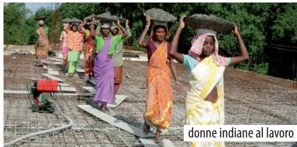
donne indiane al lavoro

In particolare si implementerà un programma di microcredito nelle aree rurali e semi urbane di Calcutta che vedrà come beneficiarie dirette circa 150 donne .