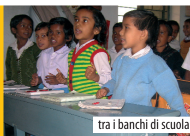
tra i banchi di scuola