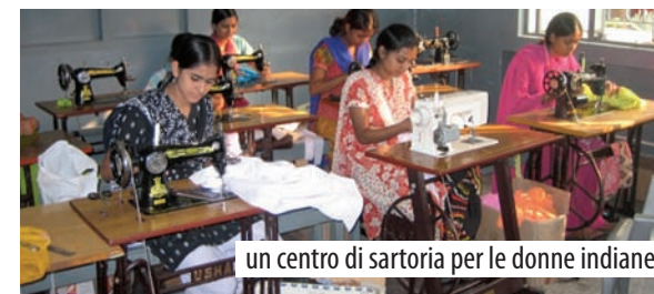
un centro di sartoria per le donne indiane

L'Albero della Vita in India interverrà sui giovani disoccupati, in particolare i Tribals, con centri di formazione professionale . Inoltre, sarà realizzato un centro di sartoria a Dhupguri e un centro di formazione tecnica a