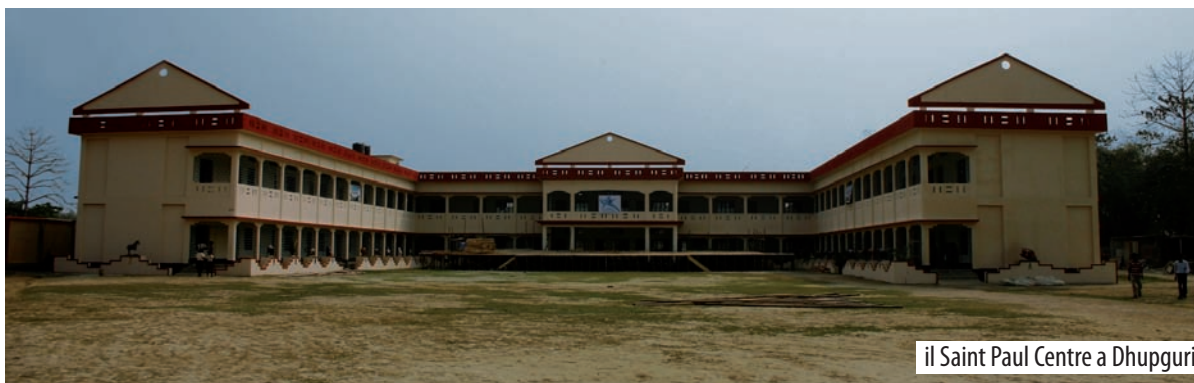
il Saint Paul Centre a Dhuppuri

Nello stesso anno L'Albero della Vita, in collaborazione con l'organizzazione bengalese Offer, ha dato continuità nelle aree rurali a sud di Calcutta al progetto Medici in Prima Linea con il programma pilota di Clinica Mobile , finalizzato a fornire assistenza medica di base e programmi di sensibilizzazione e prevenzione sanitaria alle popolazioni svantaggiate prive di accesso alla sanità. In 4 mesi di attività, nel distretto di South 24 Parganas, sono state visitate e curate 6.300 persone, soprattutto bambini e donne. Inoltre, 2.500 persone hanno preso parte a 40 campi di sensibilizzazione, nei quali medici locali hanno illustrato in maniera chiara ed efficace le pratiche quotidiane per il consumo di acqua sicura, al fine di prevenire le malattie trasmissibili; l'acqua inquinata infatti rappresenta una vera e propria emergenza. Tutti i dati raccolti durante il progetto hanno permesso di individuare quali sono le malattie più diffuse e i principali problemi sanitari dell'area, e saranno utilizzati per un nuovo e più ampio progetto sanitario nel 2009, con lo scopo di ridurre e prevenire significativamente la mortalità infantile e materna e migliorare le condizioni sanitarie. "Medici in Prima Linea" è un progetto nazionale e internazionale: i medici indiani de L'Albero della Vita sono in campo molti mesi all'anno molte ore al giorno, affrontando l'emergenza salute nei villaggi poveri.