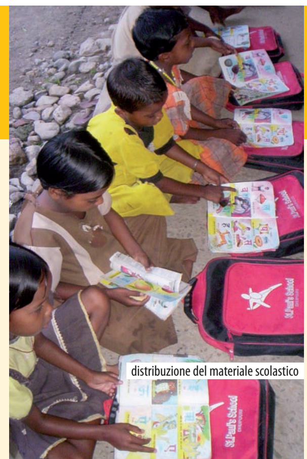
distribuzione del materiale scolastico

Leone, Romania, Ecuador, Cina, Polonia, Filippine, Capo Verde e Vietnam). Il Campus Internazionale è stato uno spazio educativo - interattivo sul tema dei diritti dei minori, uno straordinario incontro interculturale per i bambini accolti, e occasione fondamentale per gli insegnanti/educatori nell'acquisire strumenti pratici e teorici per una didattica che favorisca l'incontro, la relazione, lo sviluppo dei potenziali. Per i nostri piccoli amici indiani è stata un'esperienza di gioia!