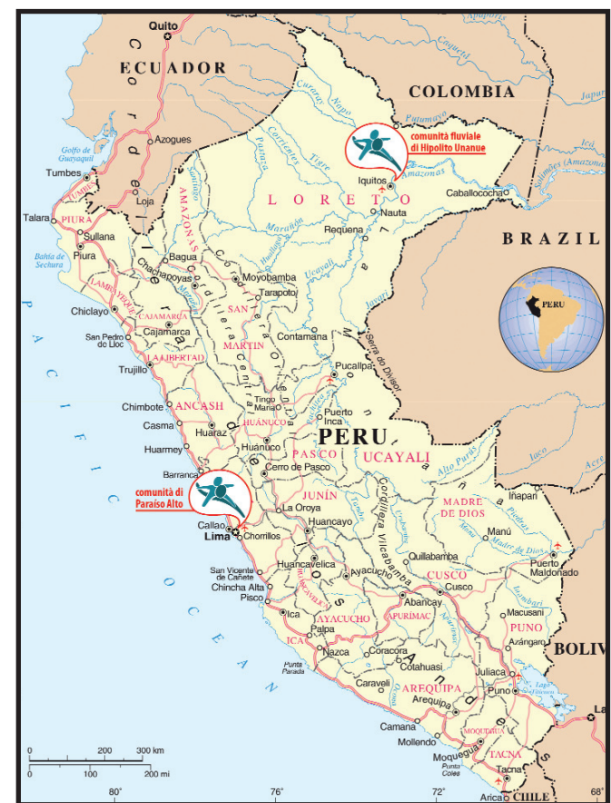
La mappa del Perù: in evidenza la Comunità fluviale di Hipolito Unanue nella regione di Loreto e la Comunità di Paraíso Alto a Lima. Più di 400 bambini e 130 famiglie godono dei programmi di riduzione del lavoro infantile, sanità ed educazione.