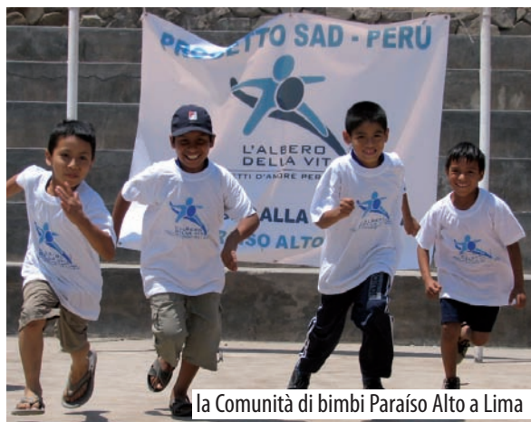
la Comunità di bimbi Paraíso Alto a Lima