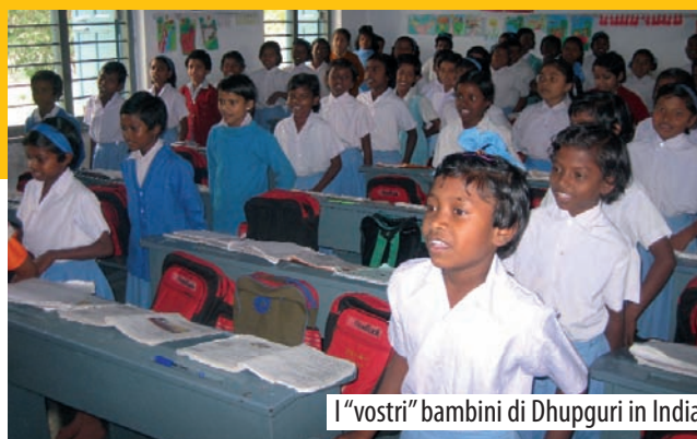
I "vostri" bambini di Dhupguri in India