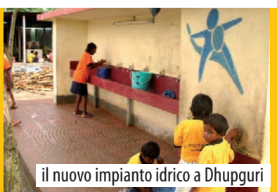
il nuovo impianto idrico a Dhuppuri