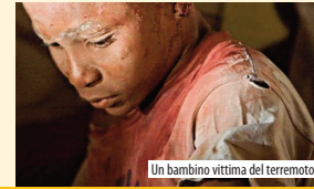
Un bambino vittima del terremoto

La situazione dei bambini e delle donne ad Haiti era già molto difficile prima che il sisma devastasse l'isola. Il paese presenta i peggiori indicatori socio economici dell'America Latina: 1 bambino su 12 muore prima del 5° anno; solo 1 su 3 è vaccinato, 1 su 4 è malnutrito e 1 su 2 non va a scuola. Haiti presenta inoltre il più alto tasso di mortalità materna nella regione: 670 decessi ogni 100.000 nati vivi. Per quanto riguarda le donne, sono soprattutto quelle in stato di gravidanza a destare le maggiori preoccupazioni.