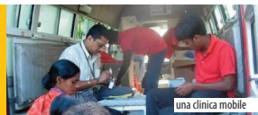
una clinica mobile

Il ruolo della Fattoria Biologica nell'economia locale di Dhupguri può contribuire in modo significativo al problema sempre più crescente della sicurezza alimentare nell'area di riferimento.