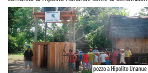
pozzo a Hipolito Hunanue

Un programma di alimentazione e assistenza sanitaria di base per le donne in gravidanza e per i bambini. Obiettivo del progetto è il miglioramento complessivo delle condizioni di salute della comunità, in particolare dei bambini. Oltre il 50% della comunità di Hipolito Hunanue soffre di denutrizione