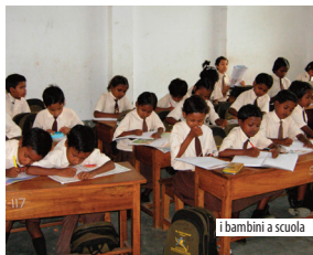
i bambini a scuola

L'Albero della Vita è impegnato dal 2005 nel sostegno all'infanzia a Calcutta e in alcune aree circostanti, e nel distretto di Jalpaiguri, in collaborazione con i missionari Don Bosco e Carmelitani Scalzi e l'organizzazione indiana Offer, che gestiscono sia scuole pubbliche sia private. Le Azioni svolte: assicurare la frequenza scolastica ai bambini, con tasse scolastiche, libri, materiale didattico e divisa se necessaria; garantire una corretta alimentazione distribuendo pasti regolari; fornire l'assistenza medica necessaria, con vaccinazioni, medicinali e cure mediche; attività presso le famiglie di sensibilizzazione sul diritto allo studio, promozione di corrette pratiche igieniche.