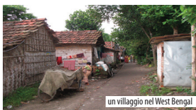
un villaggio nel West Bengal

condizioni abitative della popolazione, e anche la disponibilità di infrastrutture per la salute pubblica (numero di centri e numero di letti di ospedali per abitante) è generalmente peggiore che la media nazionale (entrambi i casi sono ricollegabili alla forte pressione demografica); gli indicatori del livello di alimentazione e nutrizione sono anch'essi preoccupanti, presentando una maggiore incidenza rispetto alla media nazionale di casi di anemia e mancanza di ferro, specialmente tra i bambini e le donne.